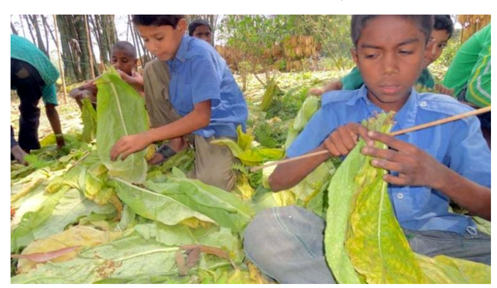
children in school uniforms processing tobacco leaves at Aditmari upazila in Lalmonirhat.

Tobacco Industry BD Watch Team, during its field investigation, has found that the students of religious institutions are taking tobacco leaves as donations. It indicates that the children are passing their childhood amid higher health and environmental risks. Tobacco aggression prevails from their home to educational institutions. Is there any future for them?