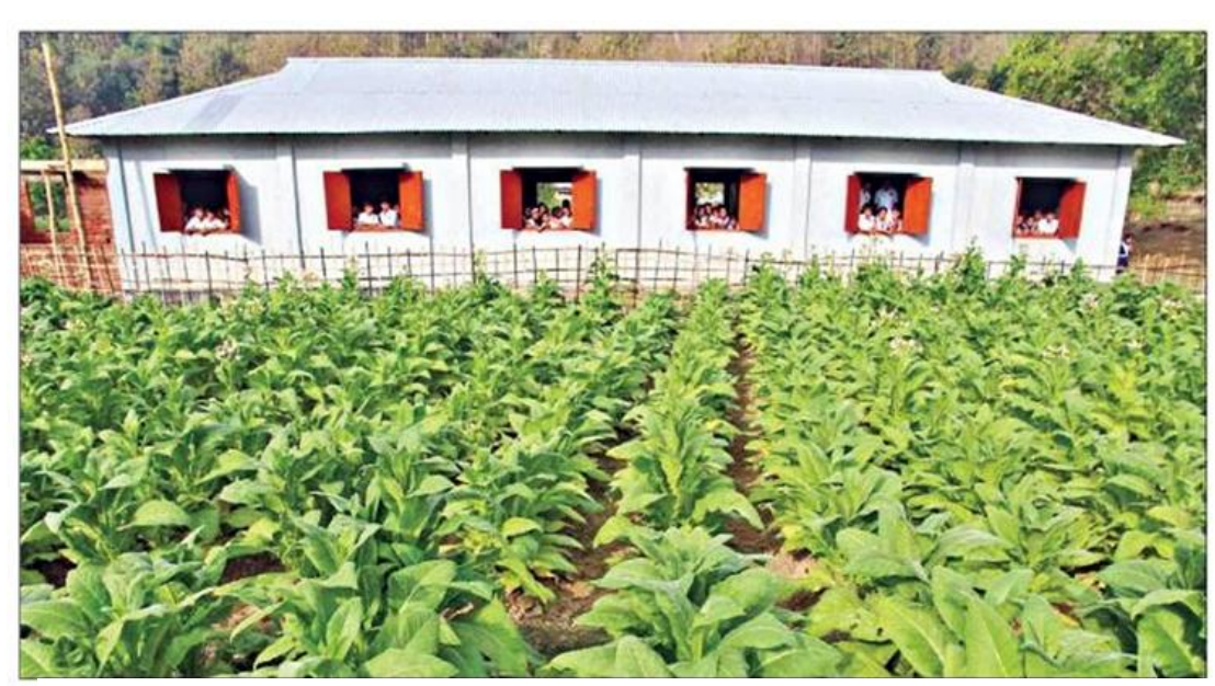
Tobacco is being cultivated in a land next to a school in Dighinala under Khagrachharhi district.

Tobacco aggression is being continued in some of the river banks and fallow lands as well. A report on March 1, 2014 on the Daily Banik Barta reads that at kilometers of the banks of Bankkhali, Matamuhuri, Gorjoi and Duchharhi – the four rivers in Cox's Bazar district have been used for tobacco cultivation. Earlier, the farmers grew vegetables on the banks. Locals alleged that the number and varieties of fishes from the rivers is declining gradually. Besides, tobacco is also being farmed in the adjacent lands of schools in the area. A photo feature on March 2, 2014 on the Daily Prothom Alo shows that tobacco is being cultivated in a land next to a school in Dighinala under Khagrachharhi district. During insecticide spray, the student rarely can sit inside the school and the teachers and students being affected with different respiratory problems. Even some of the students cannot attend classes regularly. Moreover, tobacco furnaces have been built near to schools in different parts of the country. A report on the Daily Prothom Alo on April 7, 2014 says that 9 tobacco furnaces have been built from 5-15 feet distance of 2 educational institutions which is hampering the educational activities and posing health hazard for the students too.